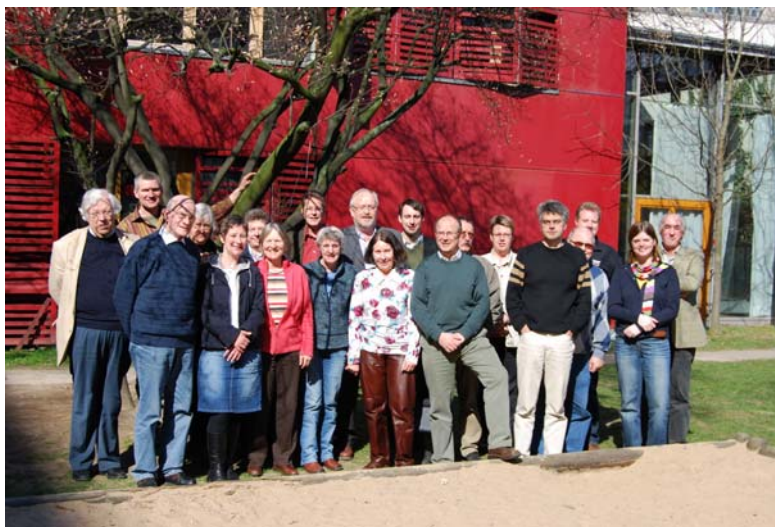
Allgemeine Kirchenratsversammlung, Köln, März 2009